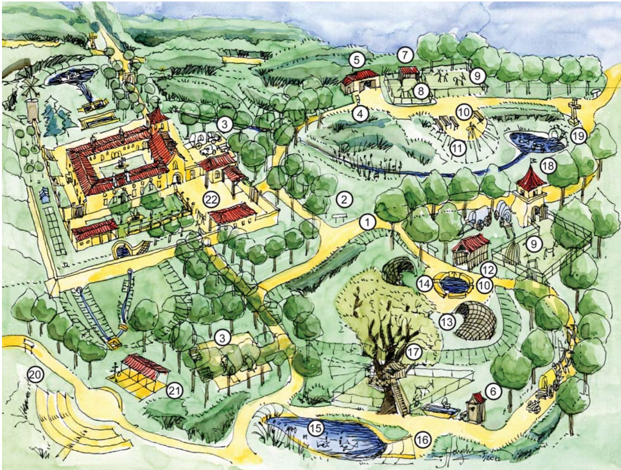
Il. 1. Elementy zagospodarowania szlaku Via Equidia : 1 – trasa konna, 2 – drogowskaz, 3 – parking, 4 – wodopój, 5 – schronisko lub stodoła, 6 – ubikacja, 7 – wiata dla koni, 8 – wybieg dla koni, 9 – łąka, 10 – miejsce piknikowe, 11 – punkt widokowy, 12 – zadaszenie, szopa lub suszarnia kukurydzy, 13 – szałas z kasztanowca, 14 – brodzik i wodopój, 15 – staw, 16 – pochylnia, 17 – szałas na drzewie, 18 – gołębnik, 19 – krzyż przydrożny, 20 – amfiteatr antyczny, 21 – wykopaliska archeologiczne, 22 – opactwo cysterskie (oprac. J. Furgalska)