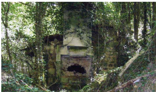
Il. 5. Ruiny zabudowań folwarku na południe od opactwa Grosbot, fragment z piecem chlebowym, 2013

Ill. 5. Les ruines de l'Abbatiale, l'ancienne ferme des cisterciens. Entre les arbres on discerne des débris de murs et d'un four à pain, 2013