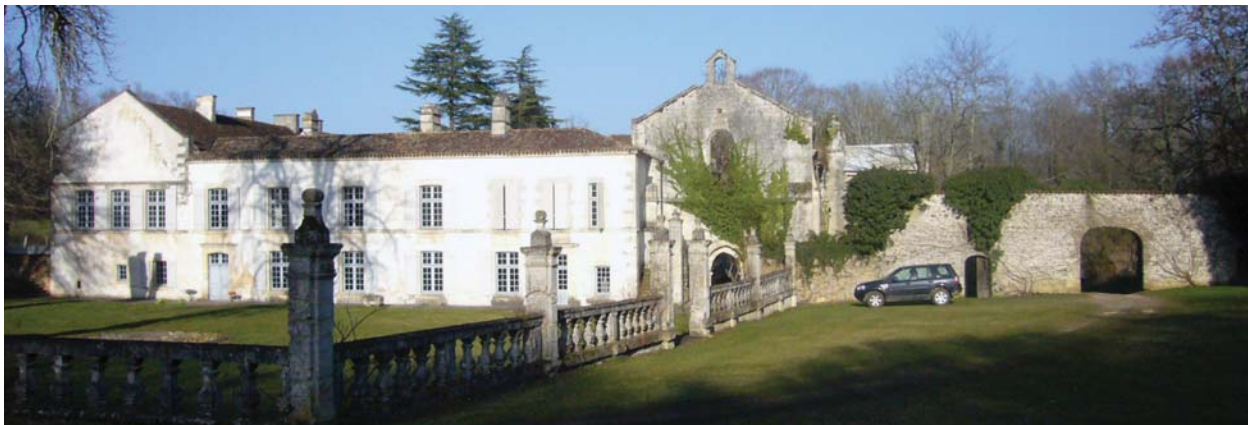
II. 4. Widok na kościół i zachodnie skrzydło klasztoru w Grosbot, 2013