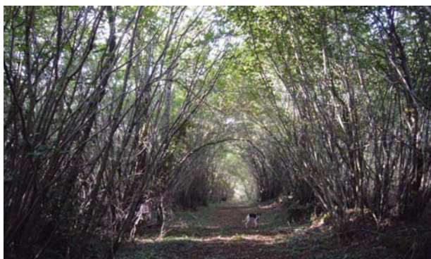
Il. 6. Aleja kasztanowców w pobliżu bramy południowej opactwa, 2013

Ill. 5. Les ruines de l'Abbatiale, l'ancienne ferme des cisterciens. Entre les arbres on discerne des débris de murs et d'un four à pain, 2013